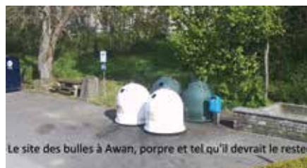
Le site des bulles à Awan, propre et tel qu'il devrait le rester